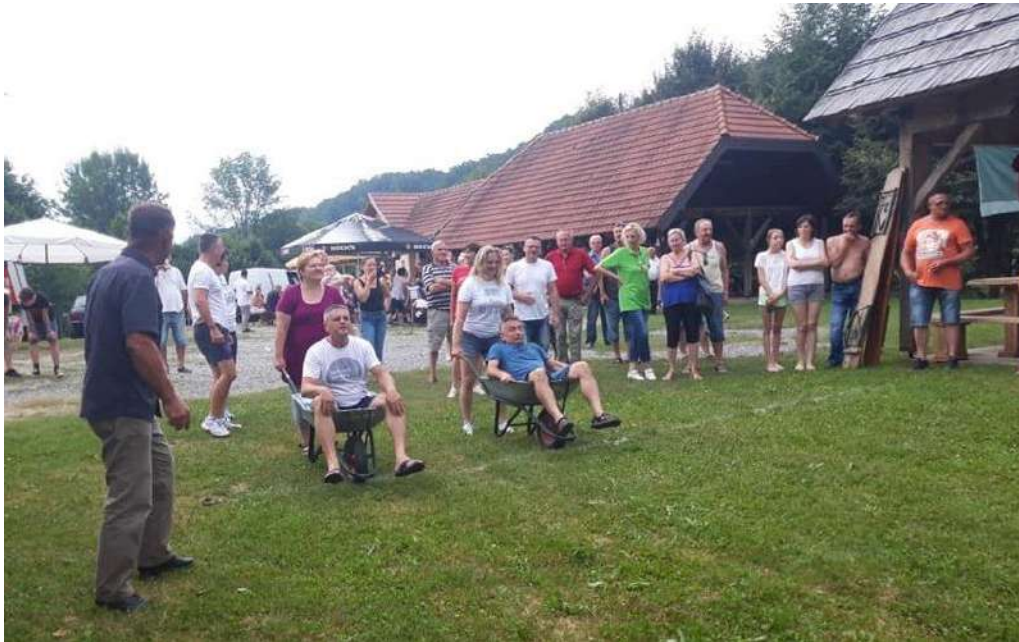
Događanje u sklopu 'Ljeta na Kupi

manifestacije te smo s predstavnicima iste radili na okupljanju različitih dionika u općini Pokupsko. Povezani su predstavnici lokalnog poslovnog sektora (ugostitelji, OPG-i) te predstavnici lokalne samouprave. Napravljena je analiza resursa zajednice te su napravljeni detaljni planovi za različite oblike ljetnih aktivnosti (ljetni sajam OPG-a, natjecanje u izradi kolača i sl.) u svrhu obogaćivanja turističke ponude, promocije općine i njenog financijskog i društvenog jačanja. Manifestacija je finalizirana sa zabavnim događanjem 'Na Kupi me pokupi'.