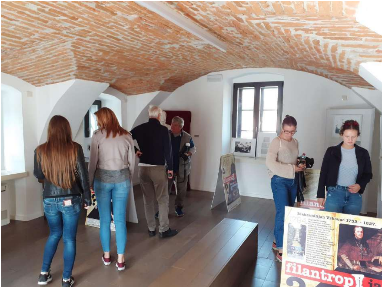
Fotografija s pop-up izložbe u Muzeju planinarstva Ivanec