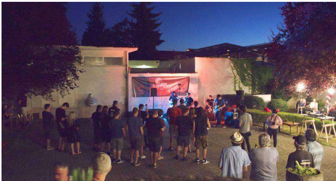
Svir ka loka

V.U.K. je udruga mladih entuzijasta iz grada Varaždina kojoj je primarni cilj podići kvalitetu društvenog, kulturnog te političkog života mladih ljudi u gradu Varaždinu. Tokom godina kvalitetnog rada, nametnuli su se na Varaždinskom području kao centralna organizacija za mlade ljude i njihove inicijative. Tokom proljetnih mjeseci 2019. godine kontinuirano smo radili sa članovima udruge na osmišljavanju kampanje pod nazivom "Ljeto za mlade u Varaždinu". Zaklada Zamah je kroz niz sastanaka/radionica za članove i volontere udruge radila na jačanju njihovih kapaciteta za namicanje sredstava, na samom ustroju udruge, kapacitetima za organizaciju događanja i sl. Suradnja je rezultirala kampanjom u kojoj je udruga u razdoblju od 20 dana organizirala niz kulturno zabavnih događanja za mlade u Varaždinu (koncerti, projekcije, radionice, dvorišna prodaja glazbenih ploča i sl.). U sklopu kampanje povezali su se sa nizom donatora (glazbena oprema, piće, hrana itd.), te su koristili prvenstveno resurse vlastite zajednice.