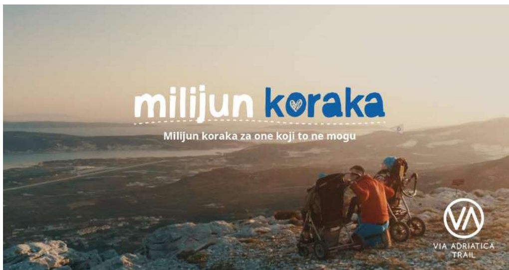
Fotografija iz kampanje 'Milijun koraka za Latice'