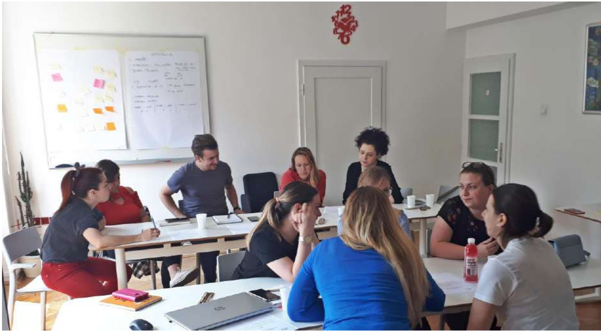
Fotografija sa radionice 'Klik za digitalni svijet'